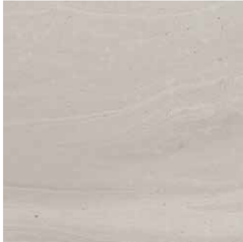
Boden- & Wandfliese Bad und WC Porcelanosa Butan Acero *