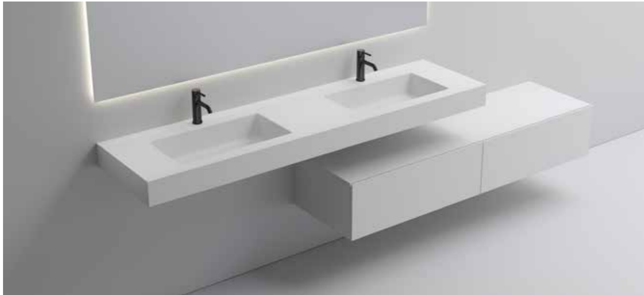
Waschtisch | VALLONE MURALE * Waschtischunterschrank | VALLONE LAX *