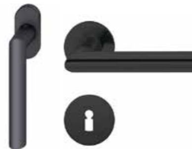
Fenstergriff & Türdrücker FSB 1079 – schwarz matt *