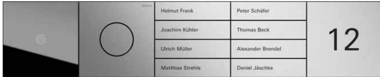
Gira System 106 Türkommunikations-System