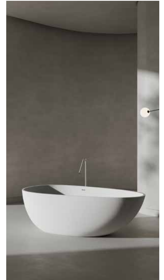
Badewanne VALLONE SA OCHE *