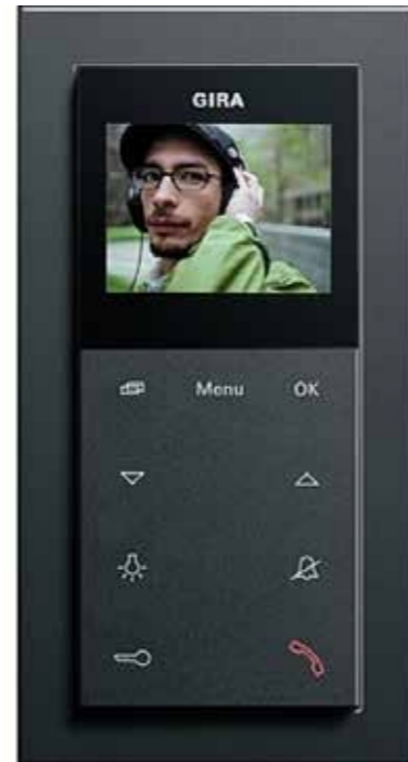
Gira Wohnungsstation Video AP *