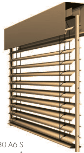
Raffstore Warema E80 A6 S Lamellen | mittelbronze *