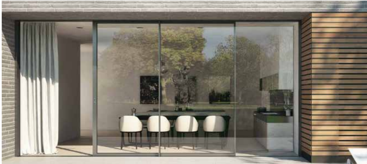
Schiebetüren Schüco ASE 80.HI Aluminium | mittelbronze *