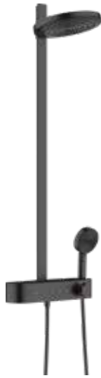
Duscharmatur | hansgrohe PULSIFY Showerpipe 260 | schwarz matt *