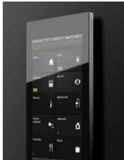
Gira G1 Home Assistant