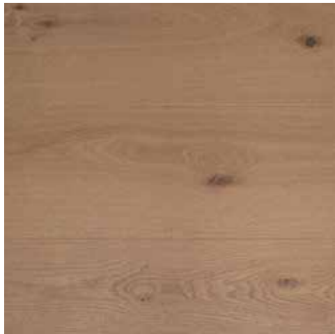
Echtholzdielen, Eiche astig geölt *