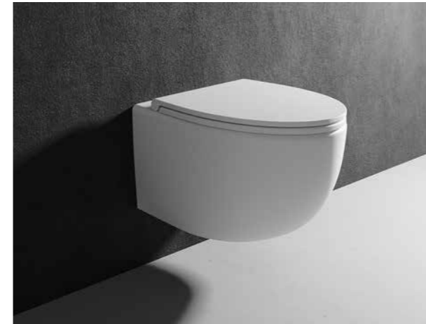
WC VALLONE VAO *