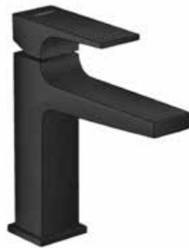
Waschbecken Armatur | hansgrohe METROPOL Einhebel-Waschtischmischer | schwarz matt *