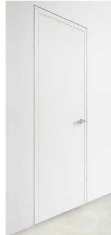
Bod'or KTM CUBE wandbündige Zarge mit Schattenfuge