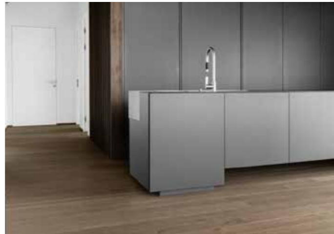
Verlegebeispiel Holzparkett Wohnbereich