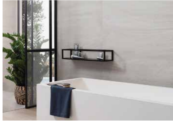
Verlegebeispiel Fliesen Badezimmer