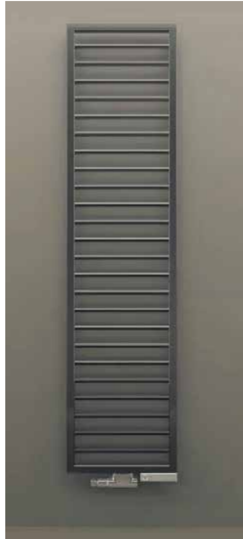
Elektrohandtuchheizkörper Zehnder Subway *

* oder gleichwertig | alternativ chrom oder weiß nach Wahl des Käufers/der Käuferin