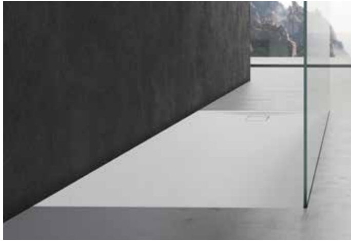
Dusche | VALLONE RIALE LOFT * Duschtrennwand | Kermi WALK-IN XC *