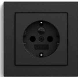
Gira E2 Steckdose schwarz matt *