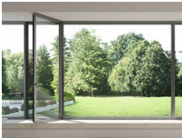
Fenster Schüco AWS 75.SI+ Aluminium | mittelbronze *