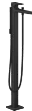
Badewannenarmatur | hansgrohe METROPOL Einhebel-Wannenmischer bodenstehend | schwarz matt *